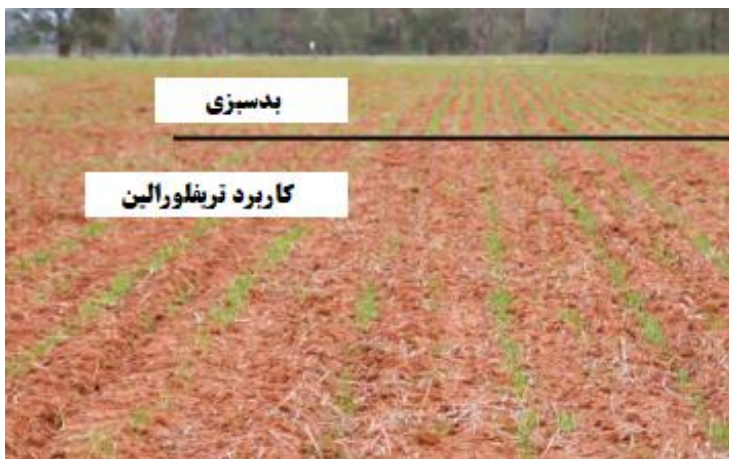
شکل ۷- پرتاب بیش از اندازه علف کش در روش IBS در مزرعه و بدسیزی ردیف‌های کاشت مجاور هم (برگرفته از Haskins, 2019).