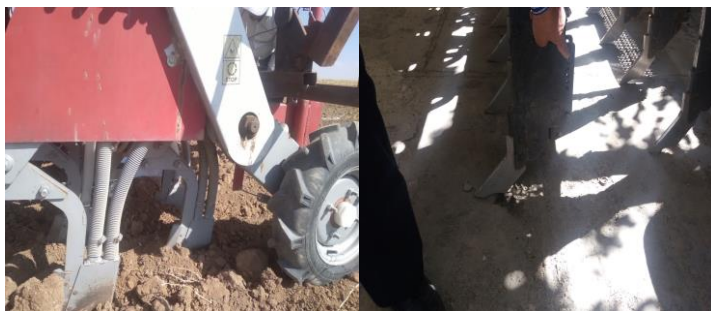
شکل ۴- تیغه‌های بذرکار همدانی جهت استفاده در کشت حفاظتی نخود.

پایه در زیر بذر به شکل نواری از قابلیت‌های این دستگاه است. با استفاده از این دستگاه، علف‌کشی که قبل از کاشت بر روی سطح خاک سمپاشی شده است، هم‌زمان با کاشت بذر با خاک مخلوط می‌شود. این در حالی است که بذر گیاه زراعی بوسیله تیغه‌های برش در حفره‌های یو (U) شکل قرار گرفته و از ناحیه آلوده به سم، دور نگه داشته خواهد شد (شکل ۱). علاوه بر این، در این روش خاک آلوده به علف‌کش از روی پشته‌های کاشت به حدواسط بین ردیف‌ها کنار زده شده و درجه تاثیر آن بر بذر گیاه زراعی به حداقل خواهد رسید (شکل‌های ۴ و ۶، راست).