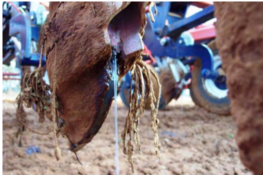
شکل ۵- پیچیدن اندام‌های علف‌های هرز موجود در مزرعه به دور تیغه‌های برش و لوله‌های نازل (برگرفته از Haskins, 2019).

مزرعه فشرده است و به دلیل نفوذ کمتر تیغه‌های برش بذرکار، بذر گیاه زراعی در عمق کمتر مستقر شده و این امر، موجب تماس بیشتر بذر با علف کش خواهد شد و کشاورزان شاهد بدسبزی بیشتر در مزرعه خواهند بود. علاوه بر موارد فوق، بهتر است قبل از کاشت محصول زراعی و به هر طریق ممکن، با علف‌های هرز موجود در مزرعه که از قبل سبز شده‌اند مبارزه شود تا جمعیت آن‌ها در طول دوره رشد گیاه زراعی کاهش و کارآیی علف کش خاک مصرف افزایش یابد. در زمان سم‌پاشی و در صورت وجود این گونه‌ها در مزرعه، بخشی از محلول علف کش را بر روی برگ‌های آن‌ها ریخته، از تماس علف کش با خاک جلوگیری کرده و از این طریق، تاثیر آن کمتر خواهد شد.