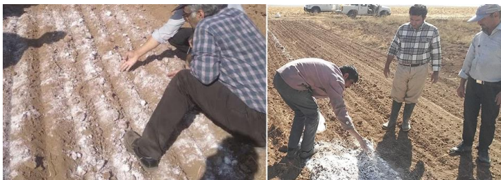
شکل ۶- آغشته کردن خاک به گچ (راست) جهت تنظیم سرعت تراکتور و ایجاد بستر عاری از علف کش (چپ) در مزرعه (عکس از مولفان).